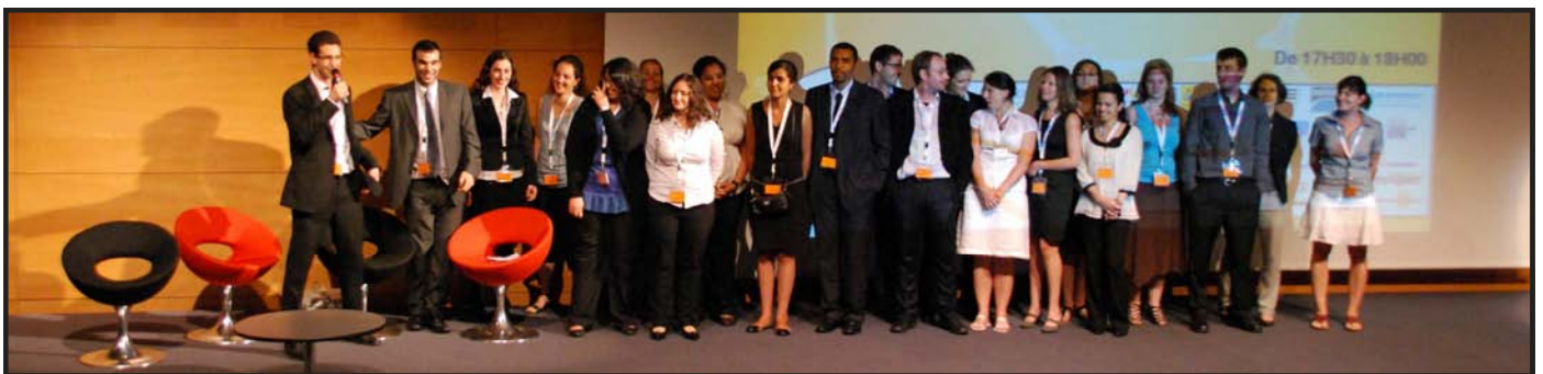
L'équipe organisatrice BIOTechno 2011