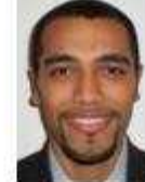
Yongoua Sandjeu BioDocs-Lyon